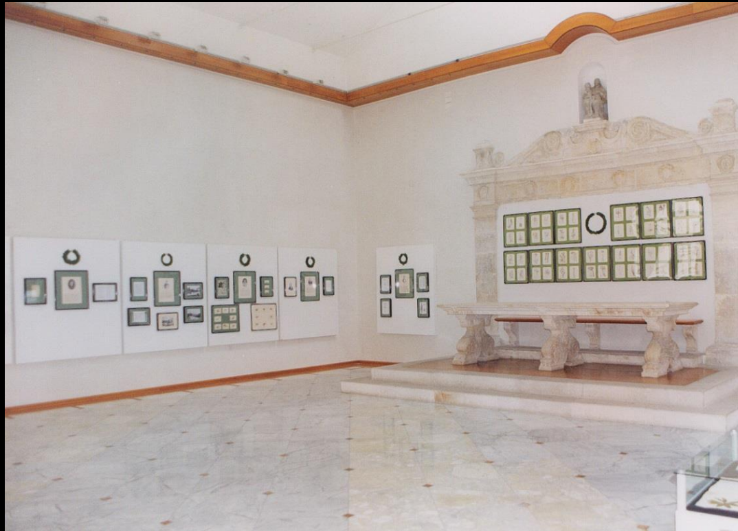
Postav izložbe Prvi botaničari u Zadru , Gradska loža, 1998.

Iako izložba izravno ne tematizira parkove, ona ima poveznice s tom temom jer upravo razvoj parkovne arhitekture koincidira s dolaskom generala baruna Friedricha von Weldena koji je podignuo prvi javni perivoj u Zadru 1829. – danas perivoj kraljice Jelene Madijevke. Barun Welden zanimao se za botaniku te je „...za tri godine boravka u Dalmaciji poslao obilje botaničkih bilježaka u Dresden i Regensburg, gdje se čuva njegov herbarij“. (COEN, 1996)