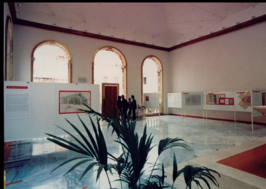
Dio postava izložbe Povijesni razvoj zadarskih vrtova i perivoja , Gradska loža, 1990.