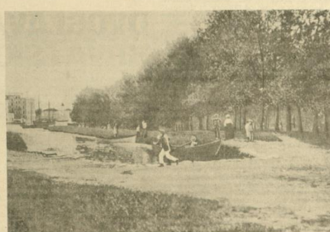
Uvala Vrnjice koscem prošloga stoljeća