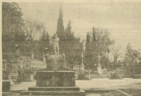
Prvi javni perivoj kojeg je uređio Friedrich Welden 1829. godine – današnji Dječji park