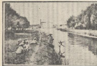
Uvula Vrljičke na početku stoljeća

Priprema za ovu tematsku izložbu Kulturno-historijskog odjela su pri kraju. Datum otvaranja se zasad ne može odrediti, jer to ovisi o završetku radova u Gradskoj loži u kojem prostoru izložba, zbog svoje kulturno-povijesne vrijednosti i poruke, treba biti postavljena