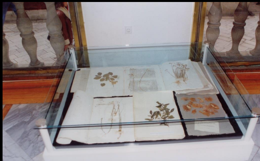
Postav izložbe Prvi botaničari u Zadru , Gradska loža, 1998.