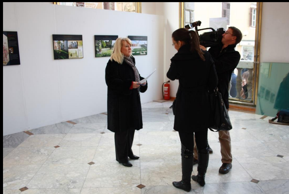
S izložbe Zadarski vrtovi i perivoji Gradska loža, 2012.