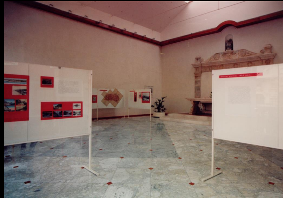
Dio postava izložbe Povijesni razvoj zadarskih vrtova i perivoja , Gradska loža, 1990.