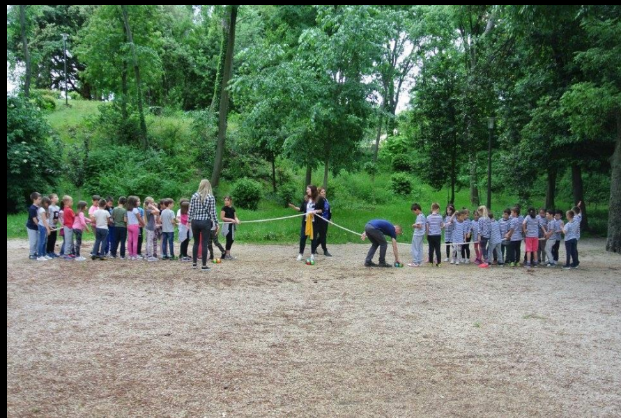
BOĆANJE I POTEZANJE KONOPA - u okviru Etno dana, svibanj 2018. , Park Vladimira Nazora