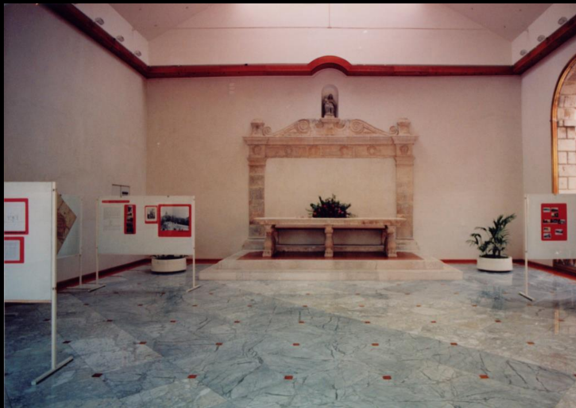
Dio postava izložbe Povijesni razvoj zadarskih vrtova i perivoja , Gradska loža, 1990.

Parkovi, perivoji i vrtovi grada djela su „...prvenstveno ljudske umjetničke kreacije te su oni, ne samo kulturna, već istodobno i vrlo vrijedna prirodna baština“ (PETRICIOLI, 2011). Kao takvi, parkovi su predmet stručnog i znanstvenog interesa muzeja s čime je povezana i misija ustanove da ovu temu prezentira široj javnosti putem izložbi i izdanja.