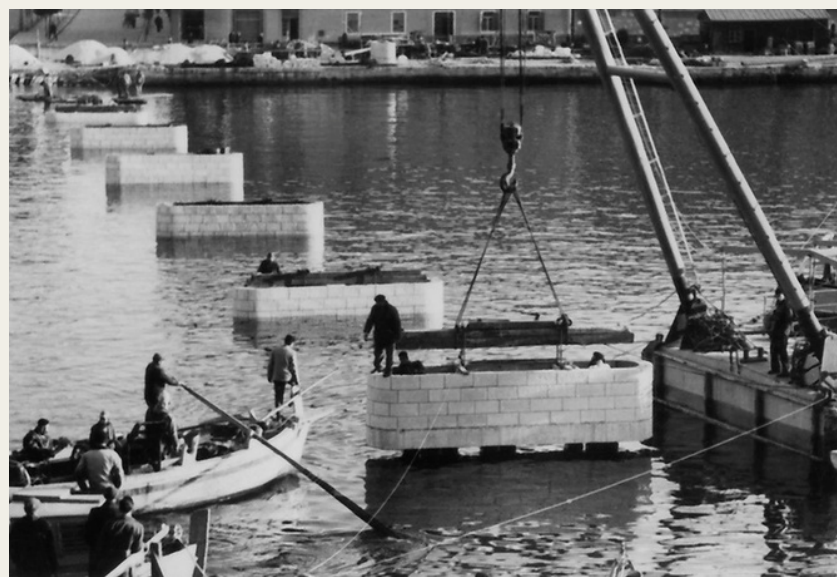
Postavljanje kamenih nosača