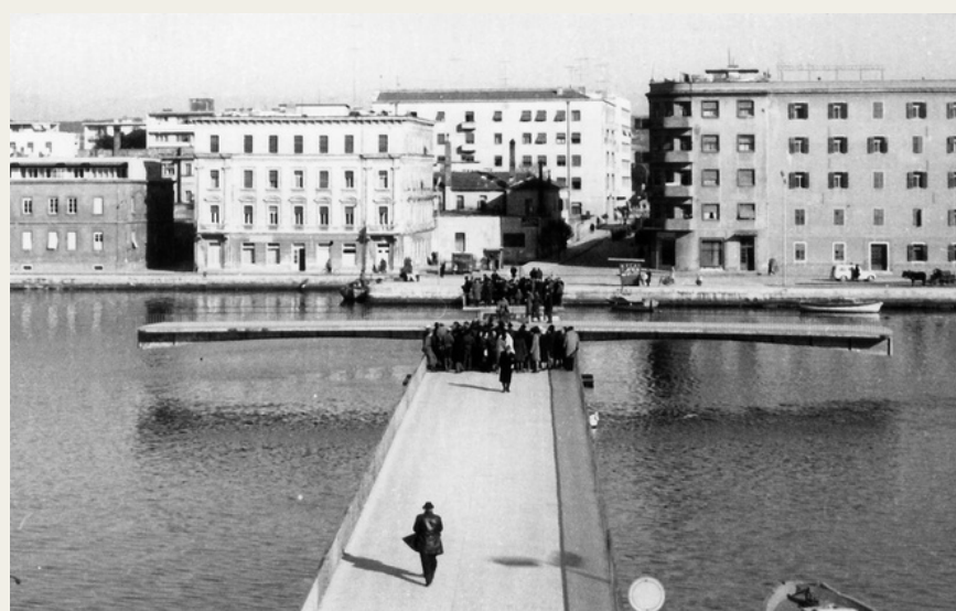
Prvo i jedino otvaranje mosta