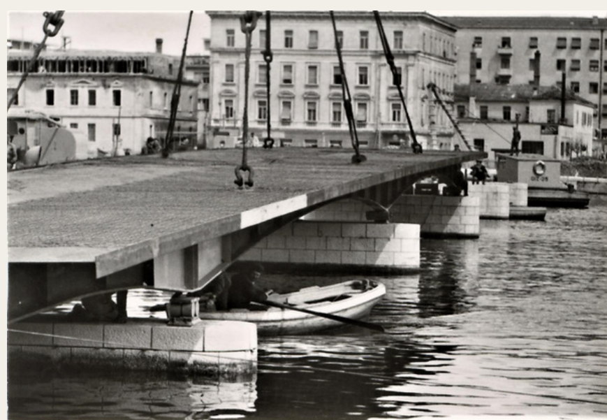
Novi most u izgradnji