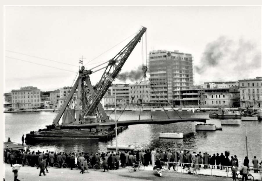
Dizalica u izgradnji novog mosta