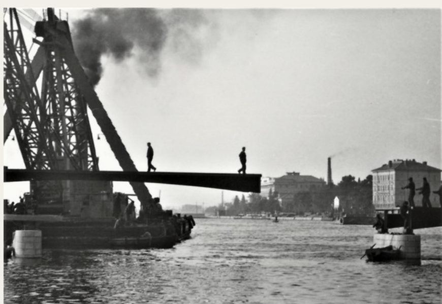
Radnici na novom mostu