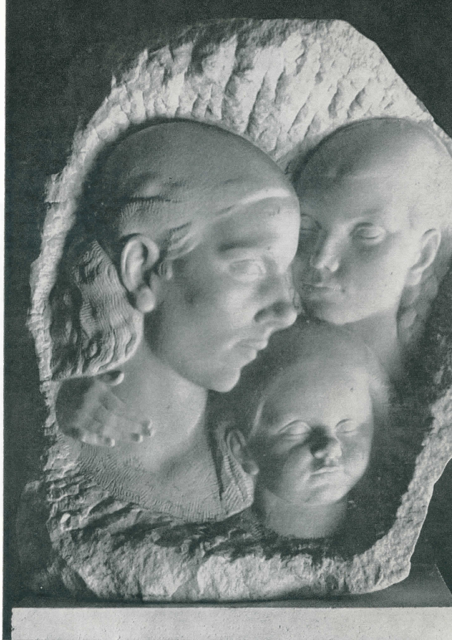
MOJA OBITELJ, KAT. BR. 10