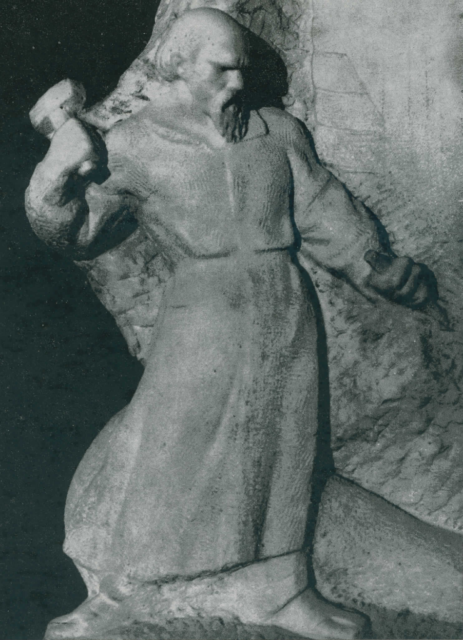
MOJ UČITELJ (DETALJ), KAT. BR. 33