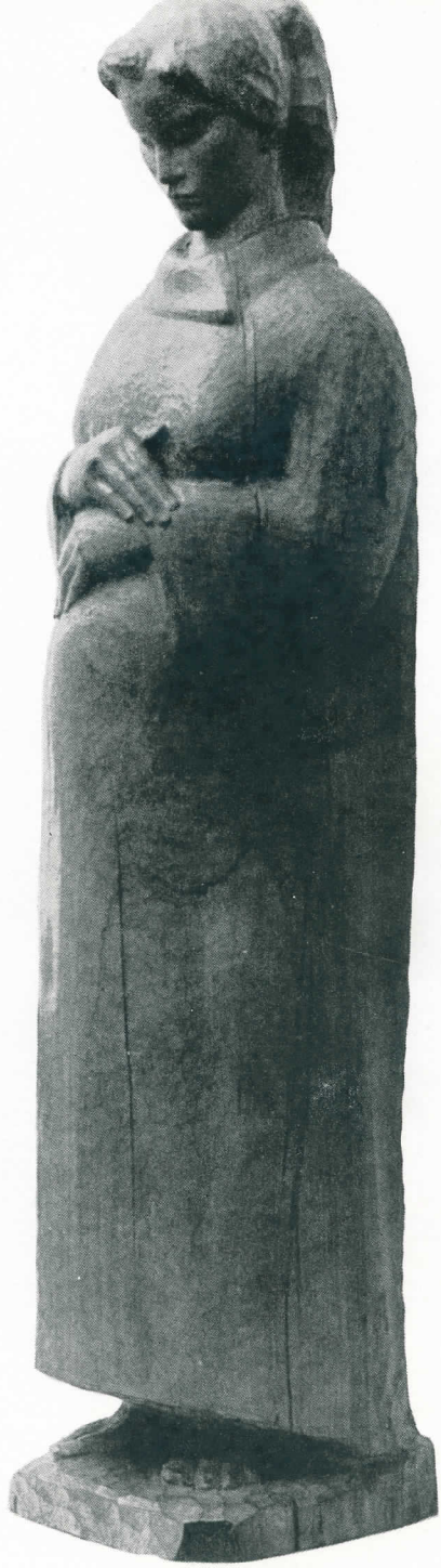
TRUDNICA, KAT. BR. 31