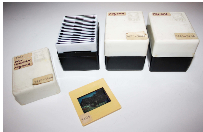
Slika 4. Pohrana diapozitiva

Diapozitivi su se umetali u plastične okvire s naznačenim inv. brojem i spremali unutar plastičnih kutijica na čijem poklopcu je upisan početni i zadnji broj diapozitiva u kutijici.