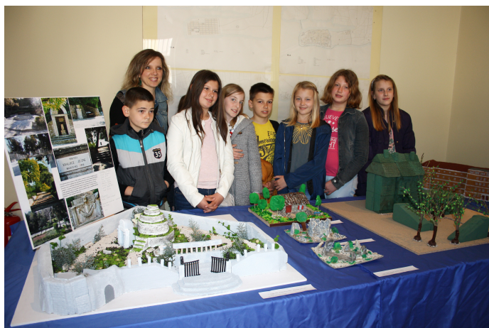
Slika 10. Učenici pred svojim radom na izložbi "Makete moga kvarta/mjesta"

Izložba Županijo, sretan ti rođendan! priređena je u sklopu Županijskih dana kao posebna čestitka županiji, a organizirana je u suradnji Pedagoške službe muzeja i odgojno-obrazovnih institucija na području Zadarske županije, pod pokroviteljstvom Zadarske županije.