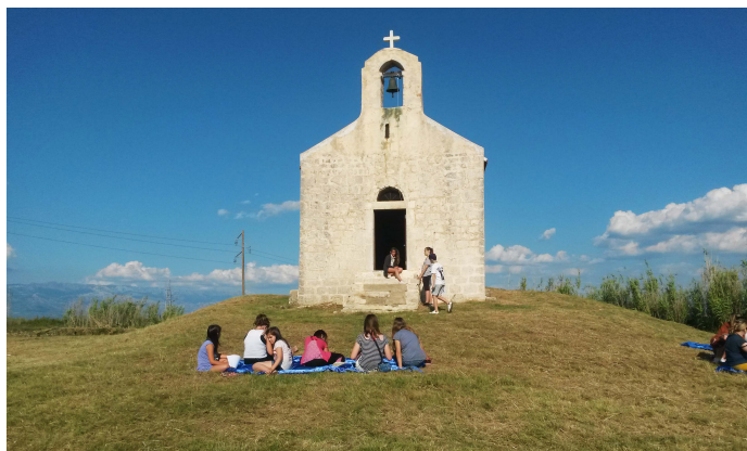
Slika 9. Projekt "Jedna škola-jedan spomenik" ispred crkve sv. Vida, Privlaka

Projekt Jedna škola-jedan spomenik je nastao na inicijativu Pedagoške službe muzeja 2011. godine, i od tada se održava svake godine u sklopu Međunarodnog dana muzeja. Projektom Jedna škola - jedan spomenik nastoji se osvijestiti najmlađe generacije o potrebi zaštite i očuvanja vrijednih kulturno-povijesnih, umjetničkih i baštinskih spomenika koji se nalaze u mjestu njihovog stanovanja, a naročito za spomenike ili spomeničke komplekse kojima su svakodnevno okruženi, njihovim porukama i značajem. Cilj projekta je i stvaranje individualne svijesti kod učenika o potrebi vrednovanja kulturno-povijesnih i umjetničkih spomenika kao svjedoka minulih vremena i kao prepoznatljivih pokazatelja identiteta grada u kojem odrastaju. Ideja programa je bila provesti ga s učenicima odabrane osnovne škole na području grada Zadra, ispred kulturno-povijesnog kompleksa koji se nalazi u blizini te škole i pored kojeg učenici gotovo svakodnevno prolaze. Ideja je ostvarena i prihvaćena s oduševljenjem u svim osnovnim školama koje su bile pozvane da sudjeluju u projektu. Od 2016. godine početna ideja likovne radionice je upotpunjena literarnim natječajem i proširena na osnovne škole u Zadarskoj županiji. Na radionicama je proteklih godina istaknuta važnost lokaliteta: Carske fontane u Arbanasima, kompleksa Trg pet bunara i Foše, spomeničkog kompleksa Forum, Narodnog trga, Gradske straže i Gradske lože, crkve svetog Vida u Privlaci.