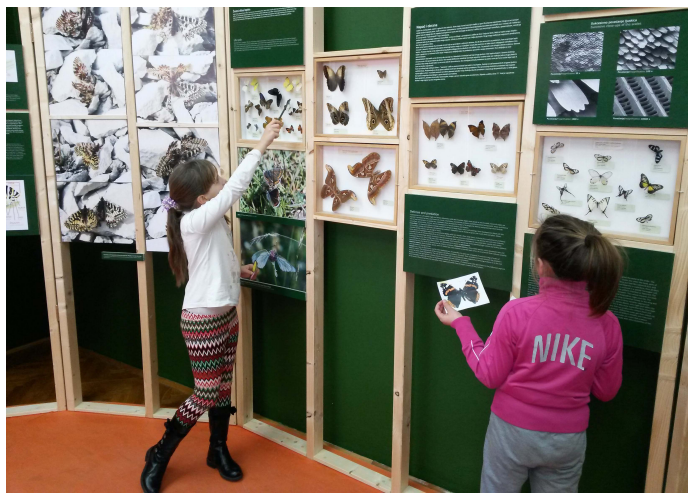
Slika 8. Radionica "Detektivska priča" uz izložbu Leptiri – baršunasti let

Radionica Detektivska priča namijenjena je mlađoj djeci vrtičke dobi te učenicima nižih razreda osnovne škole. Kroz kratku priču u obliku stripa sudionici se upoznaju s jednom vrstom leptira, kleopatrinim žučkom, koji ih kroz priču uvodi u svoj svijet. Njegov je zadatak pomoću mrlja i tragova pronaći leptira koji je popio sav nektar te mu djeca u tom pomažu. Pri tome se upoznaju s različitim vrstama hrvatskih leptira čije boje i oblik krila upoznaju kroz zbirku.